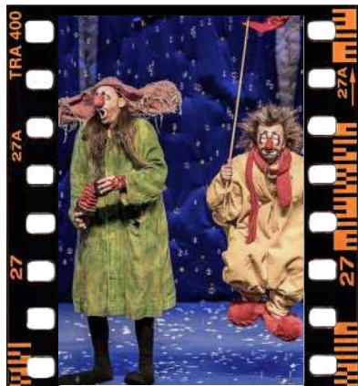
Slava's SHOW Jeudi 07 mai à 19h