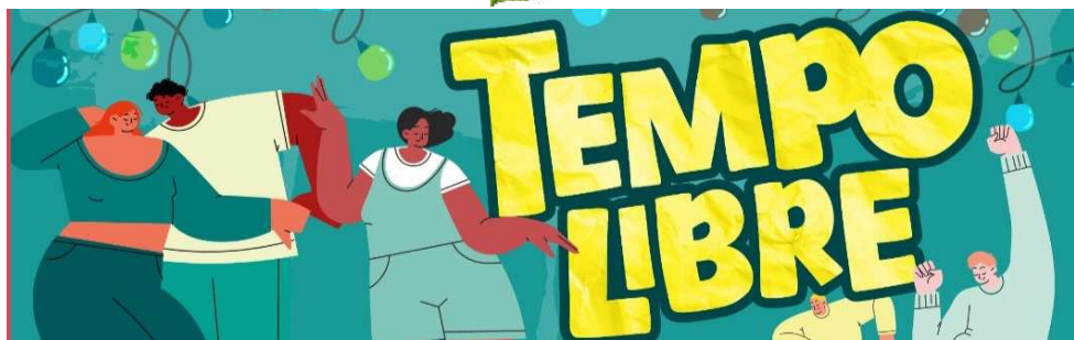
Tempo libre Samedi 30 mai