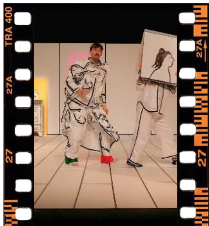
Immobile et rebondi 2 Mercredi 27 mai à 13h