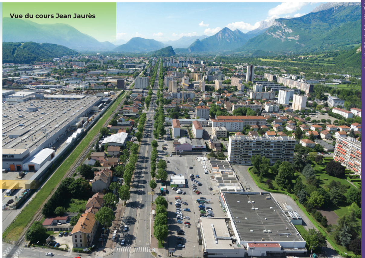
Vue du cours Jean Jaurès

Terrapublica © Credits photos: Ville d'Échirolles