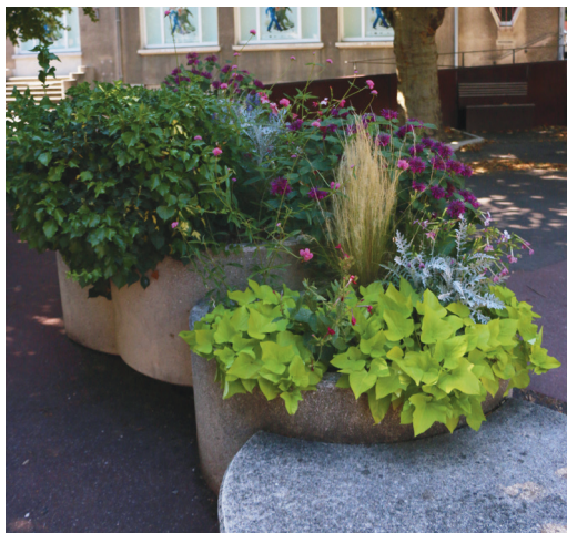
Jardinières fleuries devant le Centre du graphisme.

Une ville qui s'est construite en quelques décennies. Cette urbanisation s'est toujours accompagnée d'espaces verts nombreux et de qualité, publics ou privés.