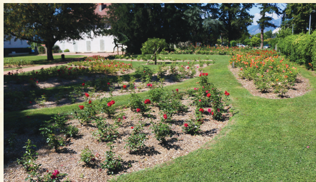
Roseraie du parc Géo-Charles.