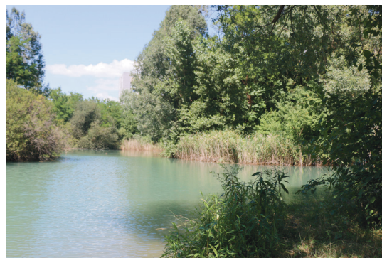
Étang du parc Géo-Charles.

En 2018 , les couleurs rose (50 %), bleue (30 %), blanche (20 %), sont privilégiées.