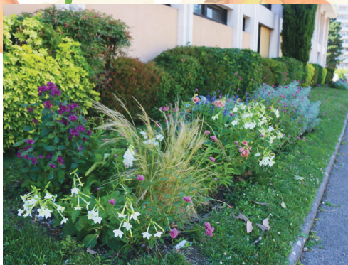
Massif floral, extérieur école Paul-Langevin.