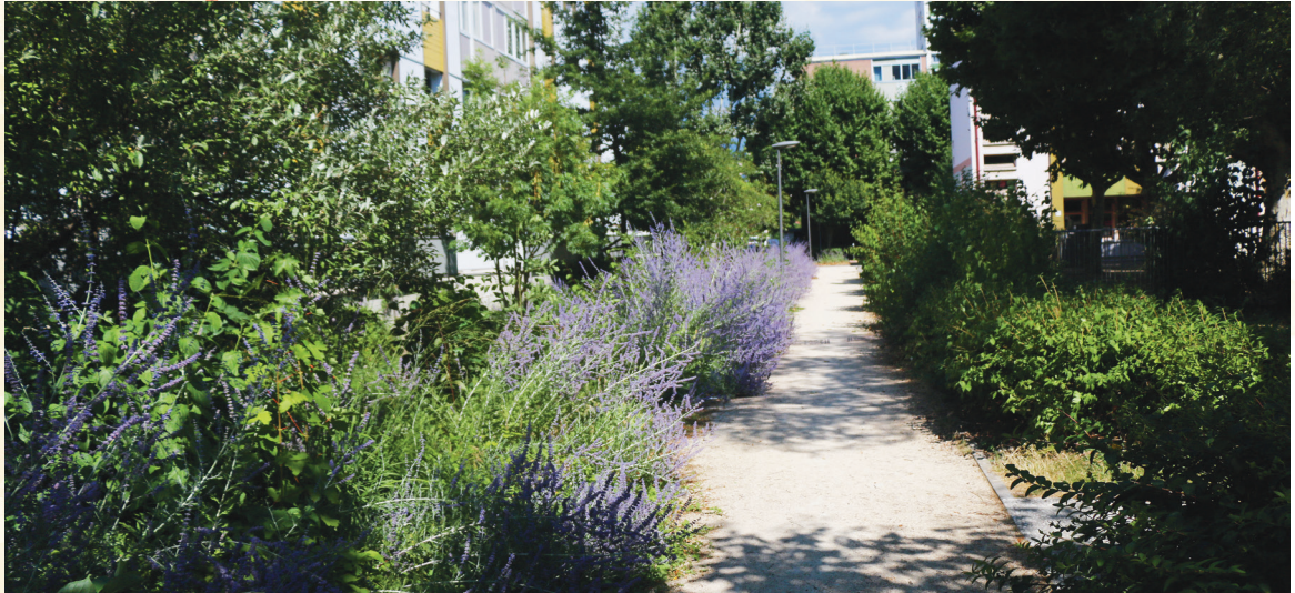
Massifs de vivaces et d'arbustes dans le Village Sud.