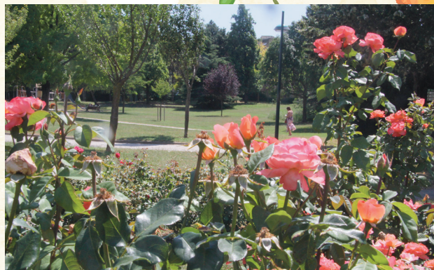
Roseraie du parc Maurice-Thorez.