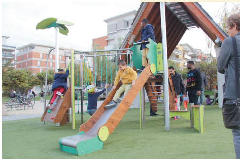
Nouveaux jeux au square du Champ-de-la-Rousse.