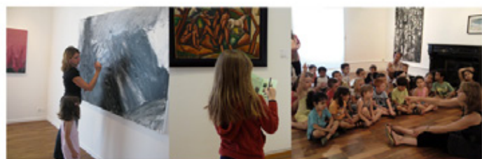
Élèves en visite au musée

Parcours ludique de la collection permanente (1h00) : Visite de l'exposition sous forme de dialogue entre l'animatrice et la classe où les élèves sont amenés à observer les œuvres avec attention.