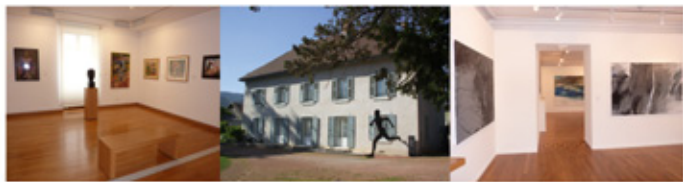
Vues du musée, 2011

Lieu de promotion et de diffusion de l'art actuel, le musée s'ouvre à la diversité et à l'audace des jeunes créateurs, une attention particulière est accordée à la photographie et à la vidéo. La présence de l'art contemporain entretient un vrai dialogue avec la donation Géo-Charles et les pratiques artistiques notamment celles qui mettent en valeur le langage du corps.