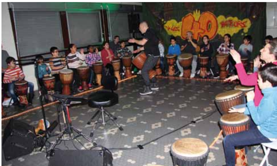
Représentation des élèves de l'école Marcel-Cachin dans le cadre du parcours avec les 40 Batteurs.

Direction des affaires culturelles Claire Sargos c.sargos@ville-echirolles.fr 04 76 20 64 29