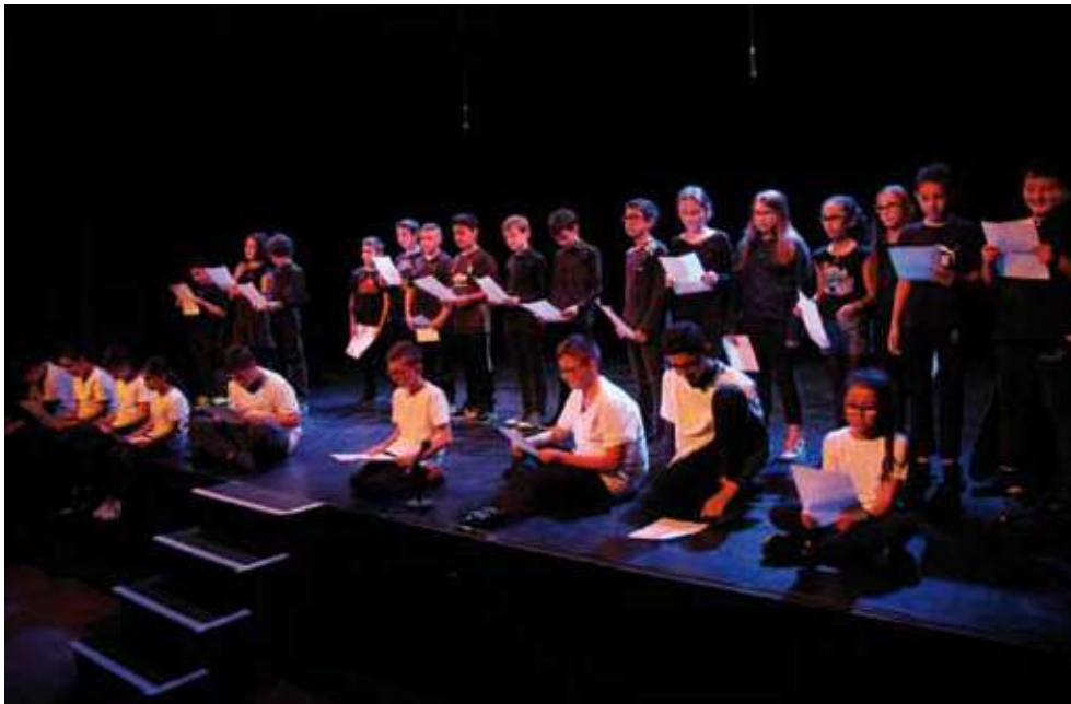
Lecture à voix haute des textes écrits par les élèves dans le cadre du projet Regards croisés.

La Direction des affaires culturelles propose une intervention régulière d'un-e musicien-ne intervenant-e auprès des cycles 2 afin de contribuer à l'acquisition des fondamentaux en éducation musicale.