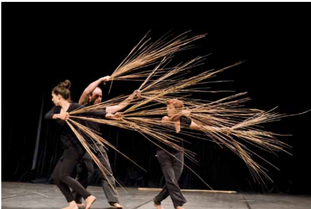
Spectacle présenté à La Rampe, Bestiaire végétal.