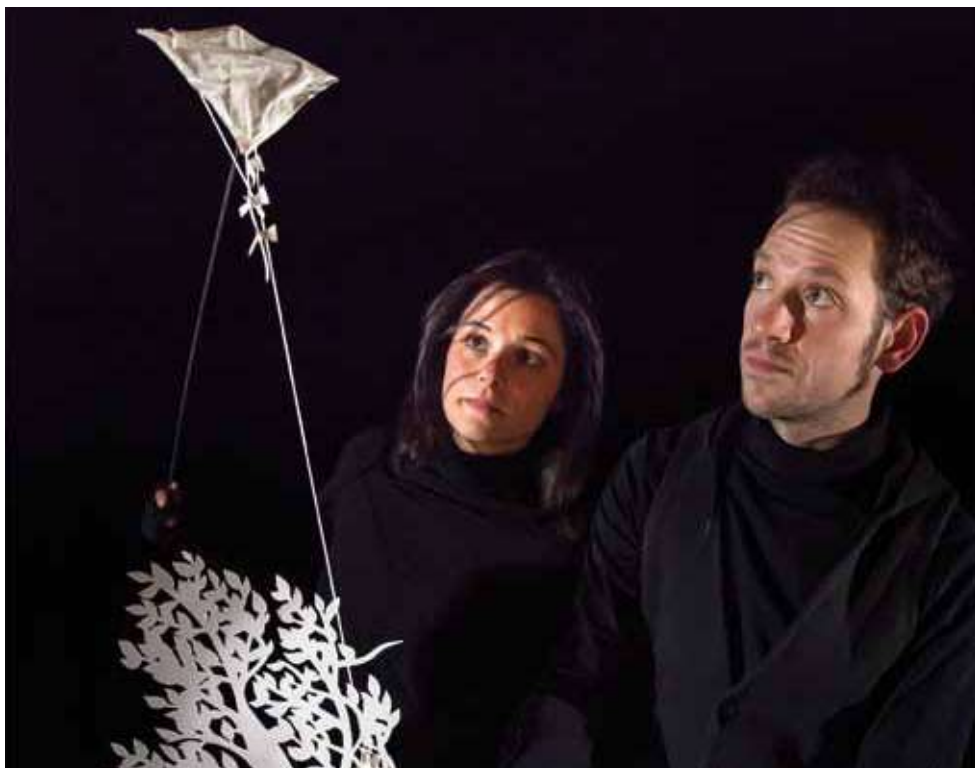
Spectacle présenté à La Ponatière, Vent Debout.

Cette première rubrique met en lumière les parcours qui croisent plusieurs langages artistiques et/ou les différents temps de l'enfant.