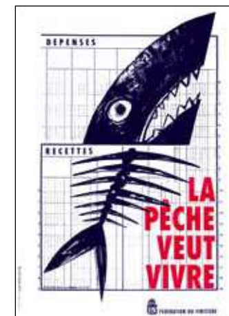
Affiche Alain Le Quernec La pêche veut vivre - 1995.