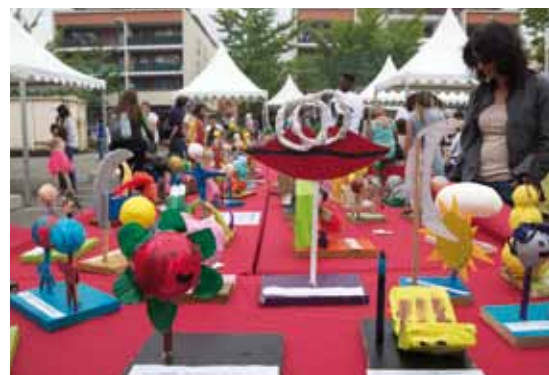
Valorisation des productions des ateliers Philo-plastique lors de Tempo Libre.

Bibliothèque Pablo-Neruda bm-neruda-jeunesse@ville-echirolles.fr 04 76 20 64 51