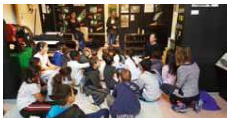
Visite d'une classe du parcours permanent du Musée de la Viscose.