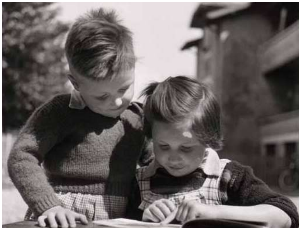
Jardin d'enfants.

Les parcours proposés s'inscrivent en cohérence avec les priorités EAC énoncées par l'Éducation nationale dans sa circulaire de rentrée 2019-2020, à savoir : “La découverte et la compréhension du patrimoine de proximité permettent aux élèves d'apprendre à voir et à comprendre l'histoire des lieux qu'ils habitent.”