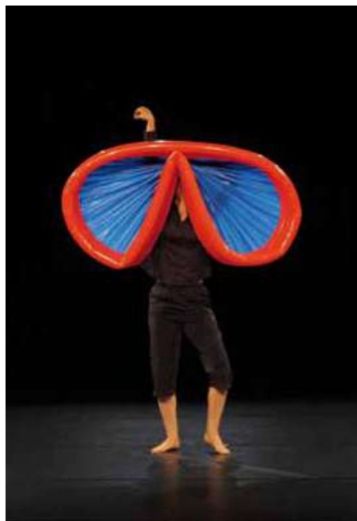
Spectacle présenté à La Ponatière La Mer et Lui .

La Maison des Écrits : Sandrine Poutineau s.poutineau@ville-echirolles.fr 04 76 09 75 20