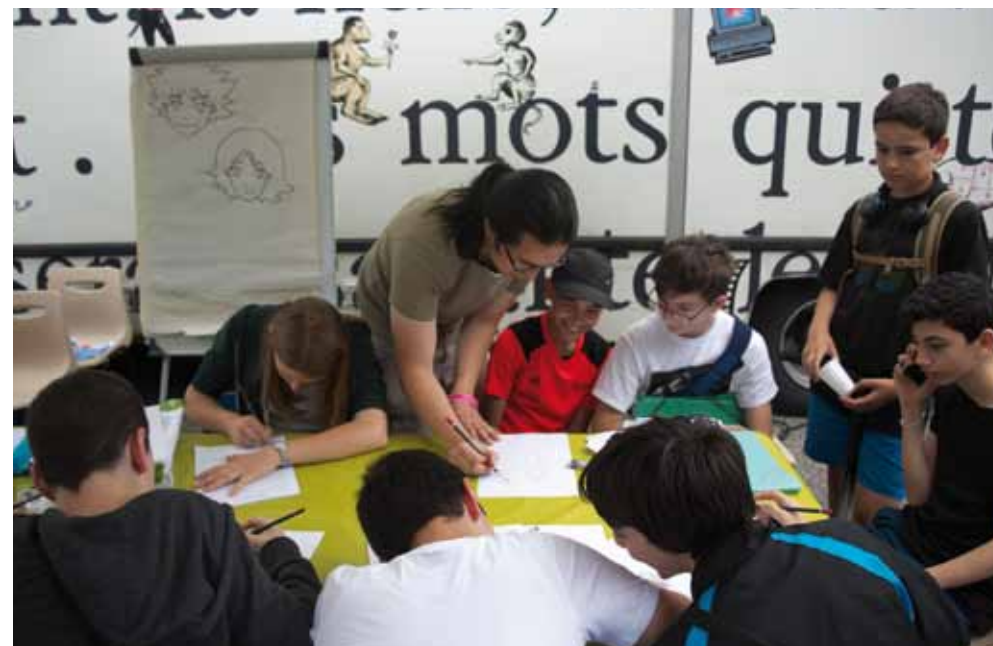
Atelier manga lors de Tempo Libre.