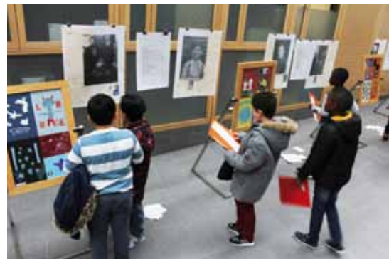
Visite d'une classe de l'exposition Entrez dans l'Histoire à l'hôtel de ville, réalisée à partir de travaux d'élèves.

Service documentation-archives : Pascale Merle p.merle@ville-echirolles.fr 04 76 20 63 90