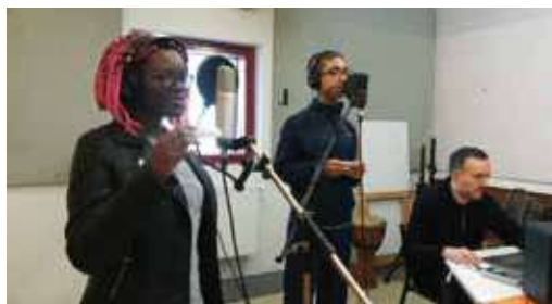
Résidence de l'artiste Insa Sané – Atelier de prise de sons avec les élèves du collège Pablo-Picasso.

Remplir la fiche-projet Musique avant le vendredi 20 septembre 2019.