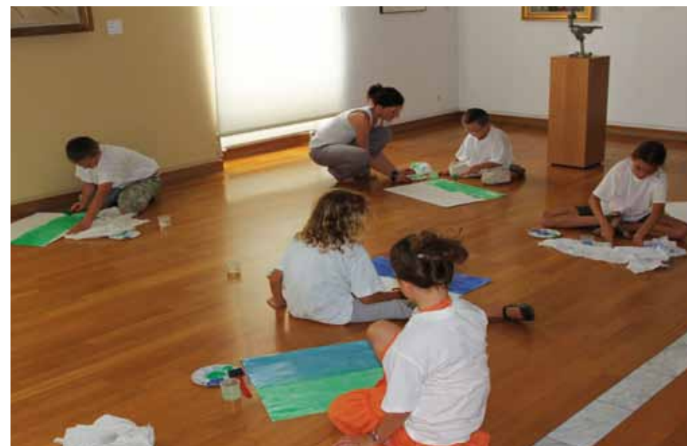
Atelier de pratique artistique au Musée Géo-Charles.