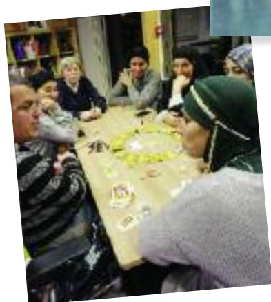
Pendant que les parents s'amuse lors d'une soirée jeux...