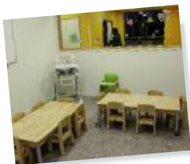
À table comme les grands !