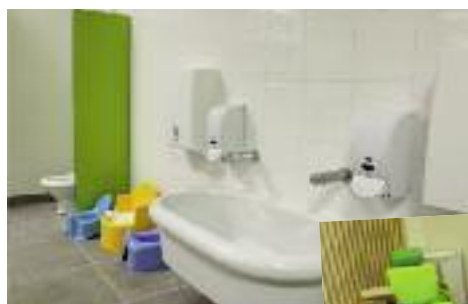
Une pièce pour l'apprentissage de la propreté.