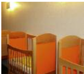
Des dortoirs organisés par tranches d'âge.