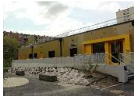
Des escaliers et une rampe d'accès pour franchir le dénivelé par rapport à la rue.