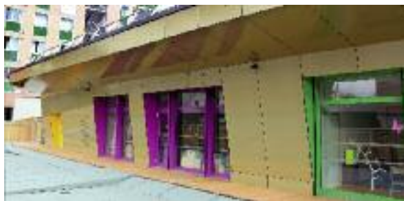
De grandes baies vitrées côté cour, au sud, avec une large dépassée de toiture pour protéger les pièces du soleil en été.