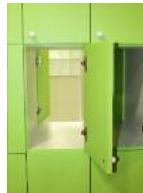
Des casiers à double entrée pour déposer et récupérer les affaires des enfants.